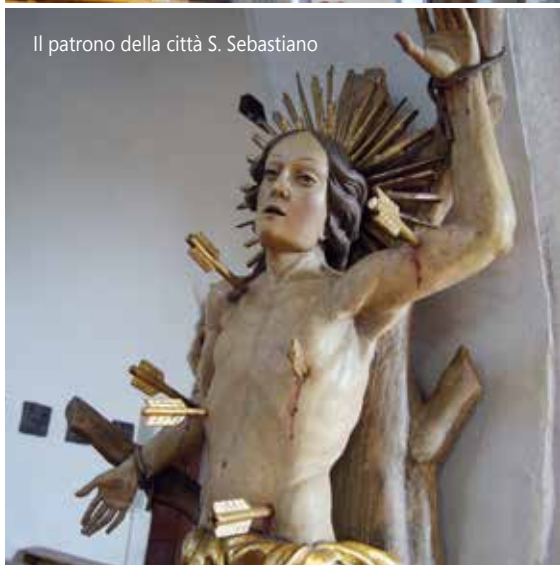
Il patrono della città S. Sebastiano