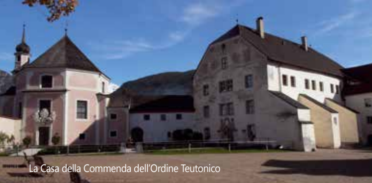
La Casa della Commenda dell'Ordine Teutonico