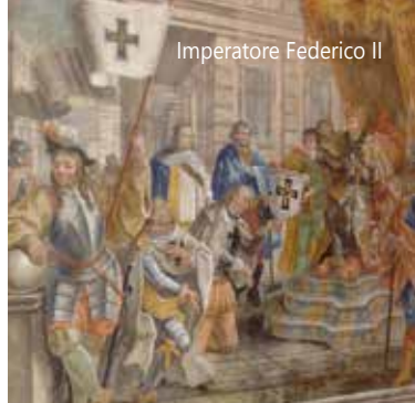
Imperatore Federico II