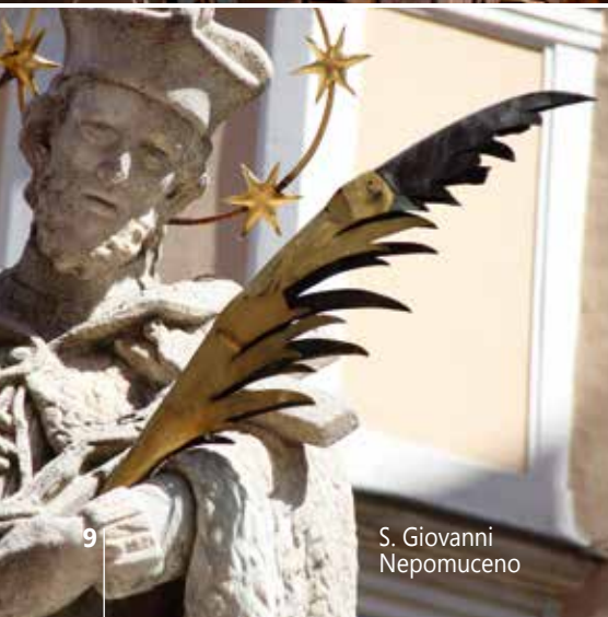
S. Giovanni Nepomuceno